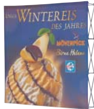
Soft Image by expolinc