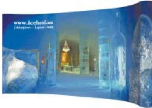
PopUp by expolinc