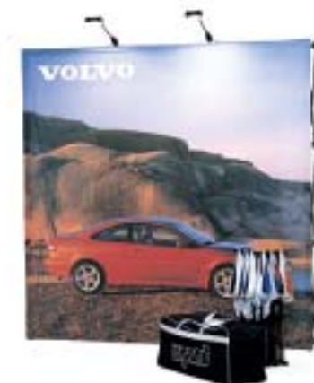
Expand Big Fabric