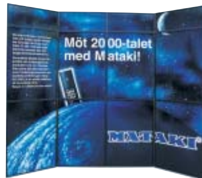
FoldUp by expolinc