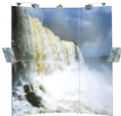
Octanorm Vario d1