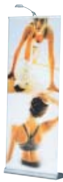
Octanorm Vario d10