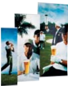
Expand Banner stand