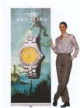
Expand Quickscreen 1