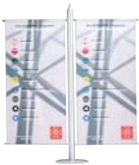
Octanorm Vario d2-Original