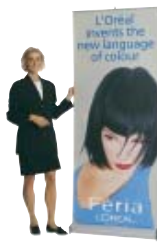
Expand Quickscreen 2